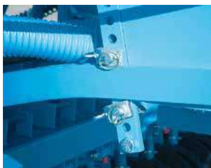
Регулировка давления сошников

Давление на сошники централизованно передается через прочный сошниковый брус.