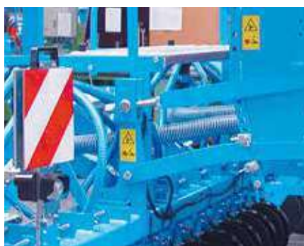
Регулировка глубины посева

Именно при изменяемых почвенных условиях независимая регулировка глубины высева и давления сошников является гарантией точного размещения семян.